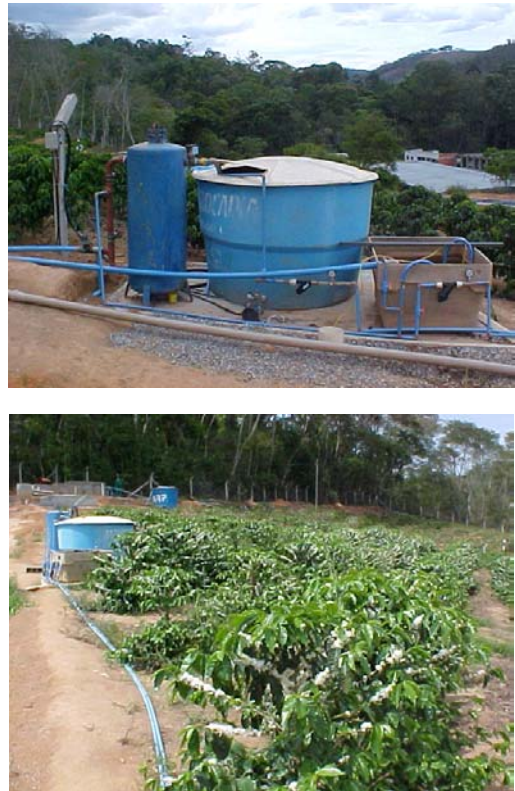
Figura 1. Infra-estrutura montada para aplicação da água residuária filtrada, à esquerda, e detalhe das três linhas de plantio, à direita

Na realização do experimento usou-se parte da Unidade Piloto, na qual se montou uma infra-estrutura para aplicação da água residuária, procedente do esgoto urbano (Figura 1). A infra-estrutura se compõe de uma linha de derivação que capta a água residuária da adutora e a conduz a um filtro de areia, para ser filtrada; após a filtração, a água residuária é armazenada em um tanque com capacidade de 2.500 L, o qual