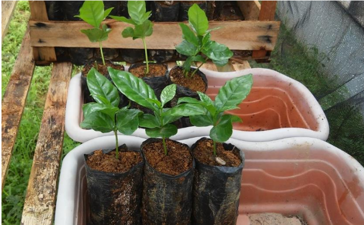
Figura 05. Jardineira com mudas em sacolas de polietileno.