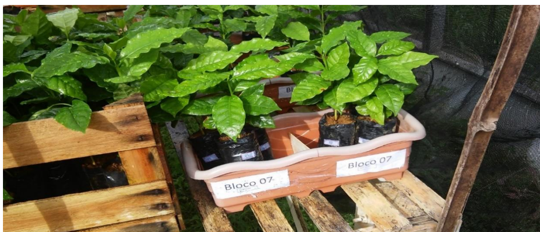
Figura 3. Mudanças de Coffea arabica L sendo aclimatadas, no estágio de 4 pares de folha, sob tela de 50% de luminosidade.

A casa de vegetação estava descoberta, sem plástico ou sombrite na parte superior e possuindo apenas uma tela com sombrite nas laterais, protegendo contra o vento e apenas isolando a casa. Desta forma, o sombrite lateral não influenciava sobre a irradiância de sol que chegava sobre as mudas nos períodos de maior irradiância, devido à localização das bancadas, desta forma não interferindo no processo de aclimação a pleno sol.