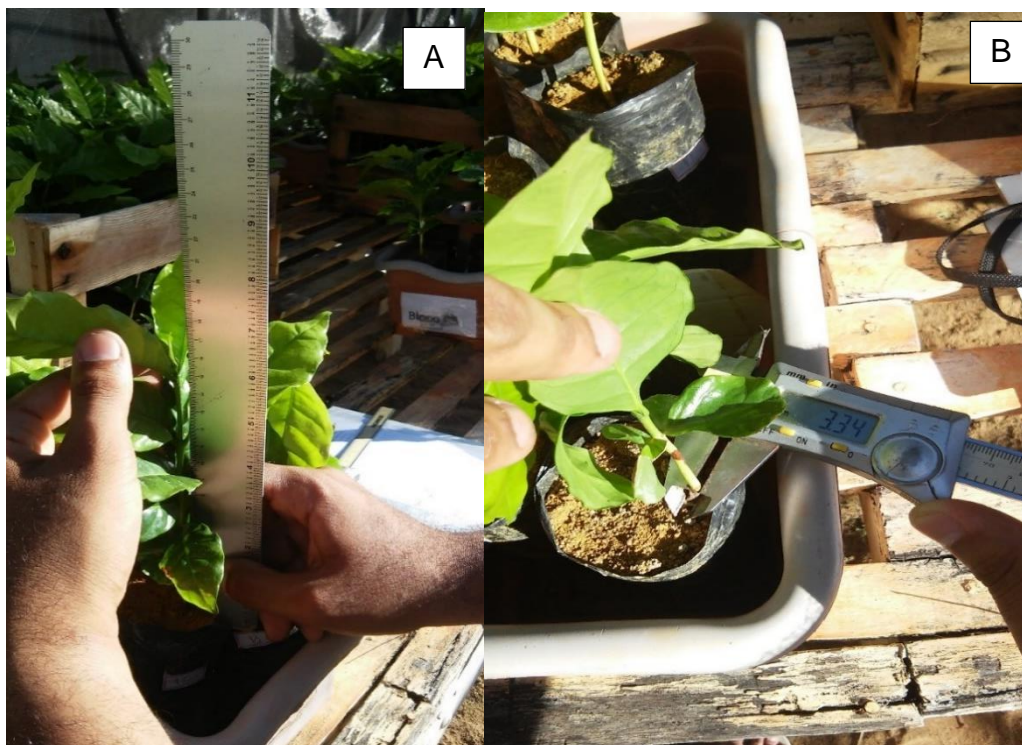
Figura 6. Coleta dos dados biométricos; A- Altura de Plantas e B- Diâmetro do colo.

As variáveis biométricas avaliadas no experimento foram: altura das plantas, por meio de régua graduada a partir da base até o meristema apical (Figura 6-A); diâmetro do colo das plantas, por meio de paquímetro digital, na base das mudas rente ao solo (Figura 6-B); o número de folhas foi contado manualmente. De forma a se manter um padrão, o mesmo avaliador foi o responsável por todas as medições, da mesma variável ao longo do experimento.