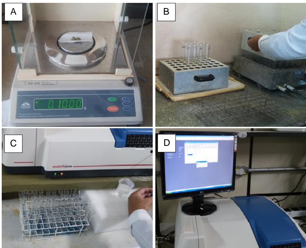
Figura 10. A) Pesagem das amostras; B) Digestão do material vegetal em ácido; C) Leitura do Potássio em Espectrofotômetro; D) Leitura dos resultados no espectrofotômetro.

Para a determinação do silício nas mudas de café foi utilizado o método do amarelo descrito por Korndörfer-Ufu e Nolla-Ufu (2004). O processo de extração de silício na planta é feito através da oxidação da matéria orgânica, isto é, eliminação do carbono do tecido vegetal com água oxigenada (digestão). O hidróxido de sódio adicionado à solução digestora tem a finalidade de melhorar a eficiência do oxidante ( H_2O_2 ) e aumentar o pH da solução, visando manter o silício do tecido vegetal em solução (Figura 11).