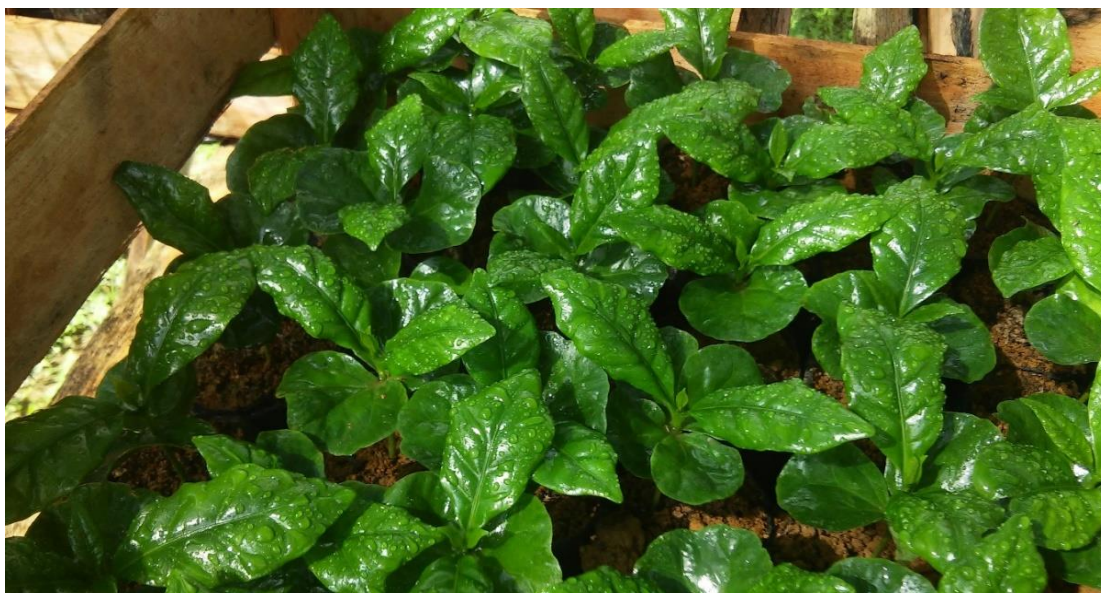
Figura 1. Mudanças em estágio inicial de desenvolvimento com 2 pares de folha.

Foram utilizadas mudas oriundas de sementes de Coffea arabica L.cultivar Catuaí Vermelho IAC 99 obtidas no viveiro comercial certificado “Eco Mudas”, localizado na cidade de Marechal Floriano-ES. As mudas foram obtidas no estágio “orelha de onça” com apenas um par de folhas, e passaram uma semana sendo irrigadas apenas, antes que fosse aplicado o silicato de potássio nos tratamentos, de modo a evitar um estresse excessivo para as mudas (Figura 1).