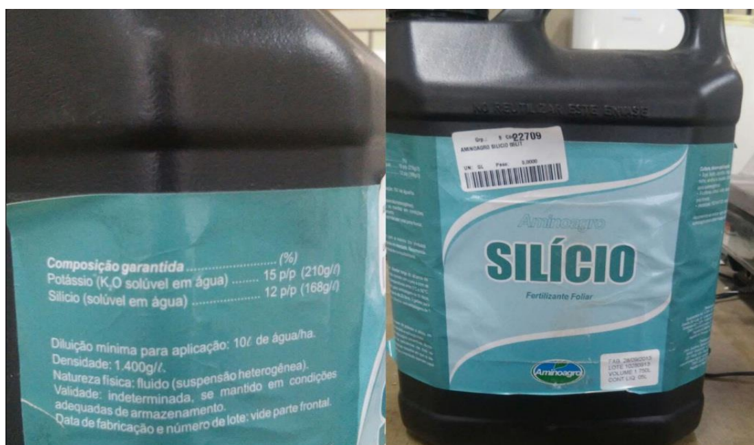
Figura 2. Produto comercial Aminoagro Silício Fertilizante Foliar ®

As plantas foram separadas em bancada isolada na casa de vegetação, para que fosse evitada a deriva do produto, pois suas aplicações foram feitas via foliar, com pulverizador manual de pressão. As aplicações ocorreram a cada 15 dias, no intervalo de 3 meses, totalizando 6 aplicações do produto ao longo do experimento. As aplicações do produto foram interrompidas quando as mudas atingiram o padrão recomendado para serem aclimatadas (4 pares de folhas) e foram posteriormente encaminhadas para a fase de aclimação.