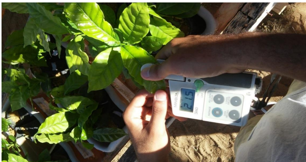
Figura 8. Medidor portátil de moléculas de clorofila modelo SPAD-502 “ Soil Plant Analiser Development ” (Minolta, Japão).

A intensidade de cor verde das folhas foi estimada por meio de um Medidor Portátil de Clorofila, modelo SPAD-502 “ Soil Plant Analiser Development ” (Minolta, Japão), entre 8:00 e 10:00 horas da manhã. Foram realizadas 3 leituras por muda nas folhas do terço médio, sendo utilizada a média destas 3 leituras para compor cada repetição (Figura 8). Após as avaliações do Multiplex e da fluorescência da clorofila a e intensidade do verde, foi realizada coleta das plantas para que fosse feita a análise nutricional.