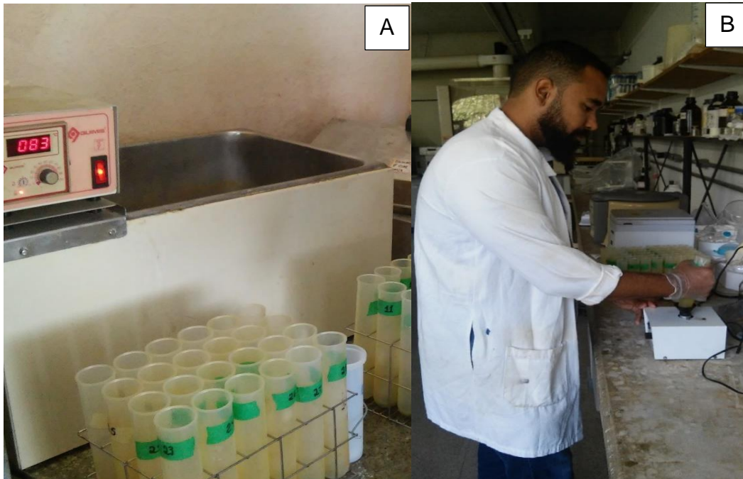
Figura 13. A) Diluição com peróxido de hidrogênio e banho-maria; B) Mistura do material vegetal diluído após autoclavagem das amostras.