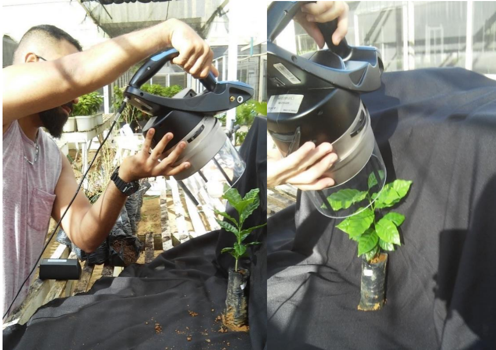
Figura 7. Análise fisiológica por meio do Fluorômetro Multiplex (Force-A)

A intensidade de cor verde das folhas foi estimada por meio de um Medidor Portátil de Clorofila, modelo SPAD-502 “ Soil Plant Analiser Development ” (Minolta, Japão), entre 8:00 e 10:00 horas da manhã. Foram realizadas 3 leituras por muda nas folhas do terço médio, sendo utilizada a média destas 3 leituras para compor cada repetição (Figura 8). Após as avaliações do Multiplex e da fluorescência da clorofila a e intensidade do verde, foi realizada coleta das plantas para que fosse feita a análise nutricional.