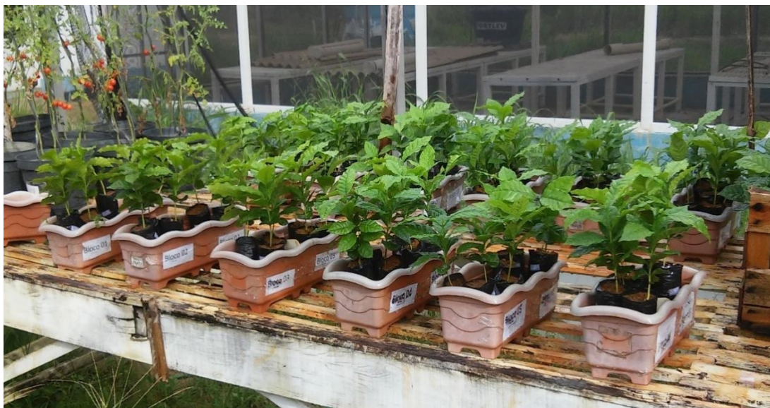
Figura 4. Mudas Coffea arabica Laclimatadas a pleno sol, em casa de vegetação descoberta.